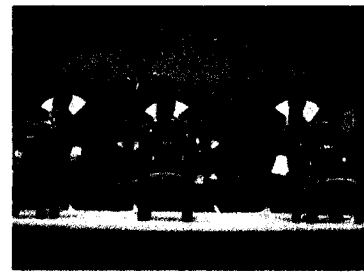
飯豊くるだ太鼓チーム

13:00~14:00 パフォーマンスショー 磐梯ダルク「飯豊くるだ太鼓チーム」演奏 飯豊権現太鼓保存会 様演奏 奥州須賀川松明太鼓花組 様演奏