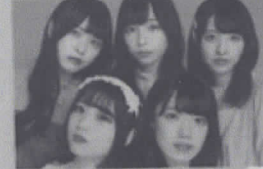
新宿 原宿アイドルユニット