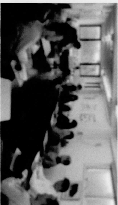
琉球太鼓(エイサー)